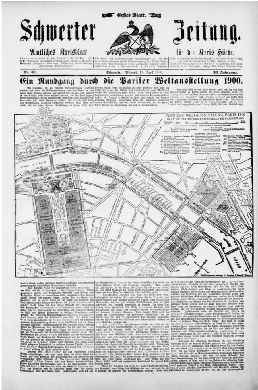
Schwerter Zeitung, Ausgabe vom 18.04.1900, Titelseite

„Die Entladung. Der erste Blitzstrahl hat gezuckt und wie ferner dumpfer Donner ertönt die Kunde: Der Kriegszustand ist erklärt. Noch ist es das Vorspiel, noch fehlt die Mobilisierungs-order, die die gesamte aufgespeicherte Kraft des Volkes zu explosiver Entladung bringt. Aber die schweren Wolken, die von Osten