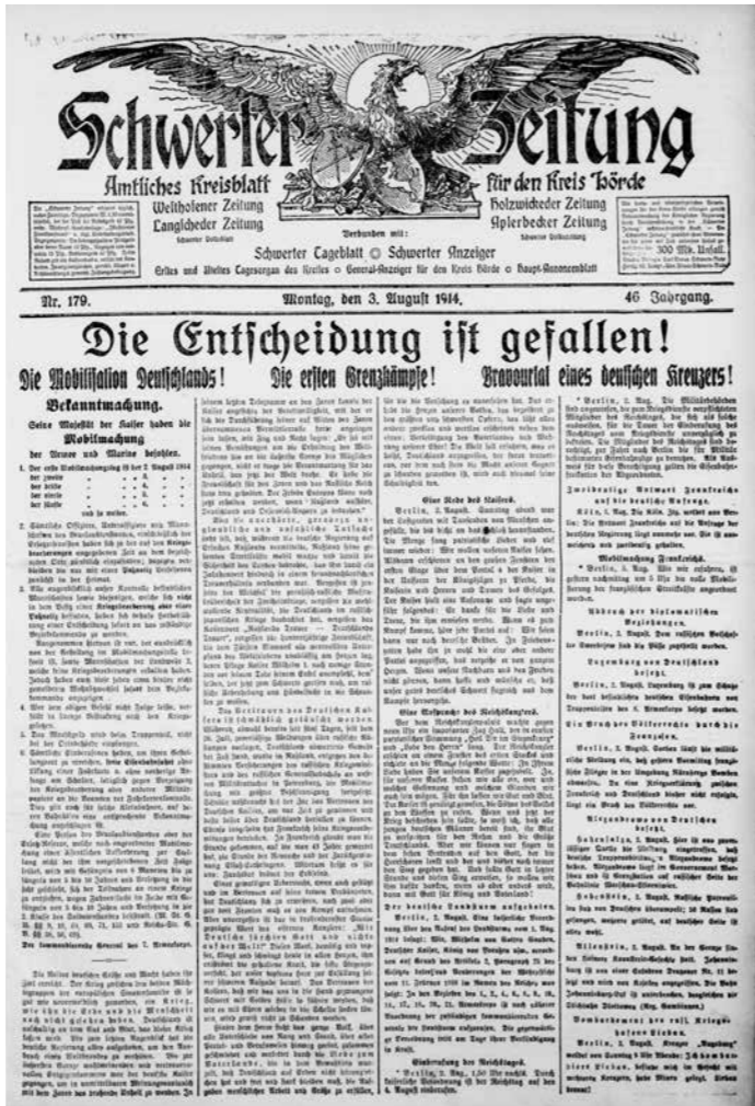
Dortmunder Zeitung und Schwerter Zeitung, Ausgaben vom 3.8.1914, Titelseiten

gen „in eigener Sache“, zitiert werden. Hier wird in beeindruckender Weise Zeugnis davon abgelegt, wie die Presse in Zeiten des Krieges in ihrer Freiheit eingeschränkt war und demnach nur bedingt ihrer grundständigen Aufgabe gerecht werden konnte: